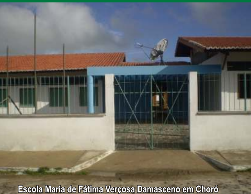
Escola Maria de Fátima Verçosa Damasceno em Choró