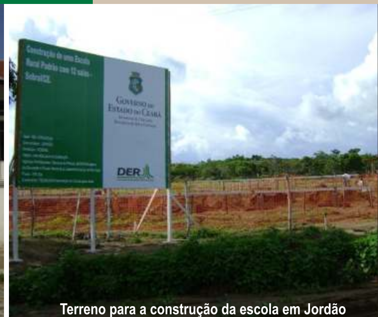
Terreno para a construção da escola em Jordão